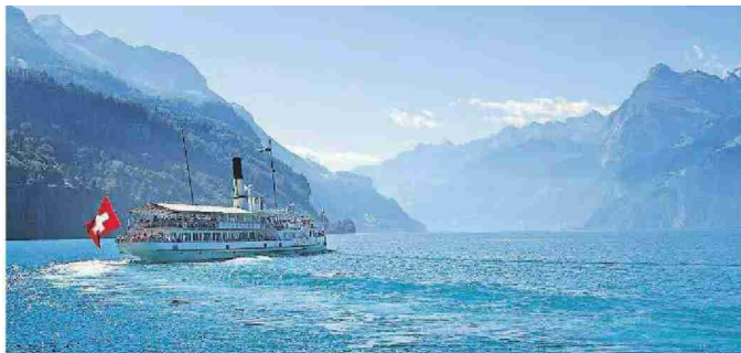
Freie Fahrt auf dem Vierwaldstättersee.

Hier waren schon unsere Grosseltern zu Besuch