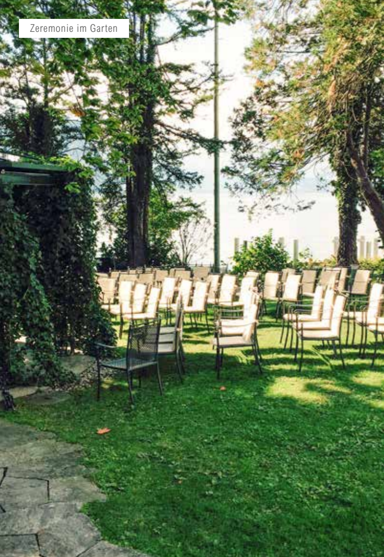
Zeremonie im Garten