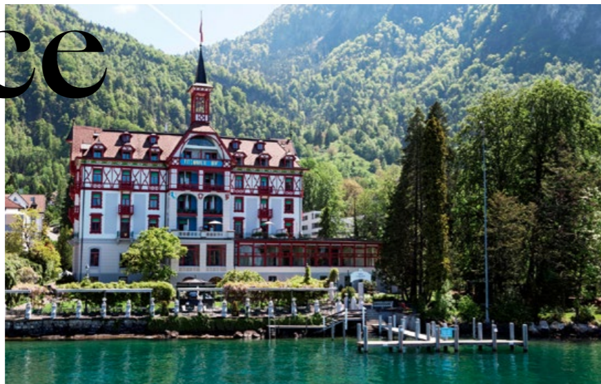
Jugendstil am Vierwaldstättersee: «Vitznauerhof».