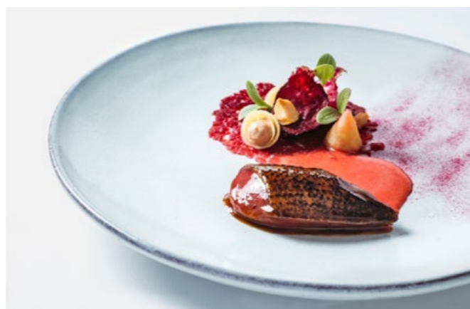
Vom Feuerring: Anjou-Taube, Rande, Macadamianuss.